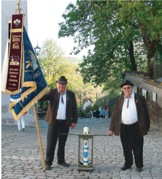
Gedenkkerze für alte St. Christophkirche