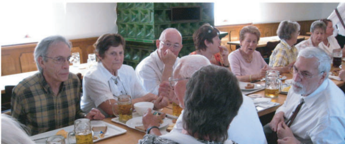
Nach dem Gottesdienst gab es noch ausreichend Zeit für eine zünftige Brotzeit und die eine oder andere kühle „Maß“