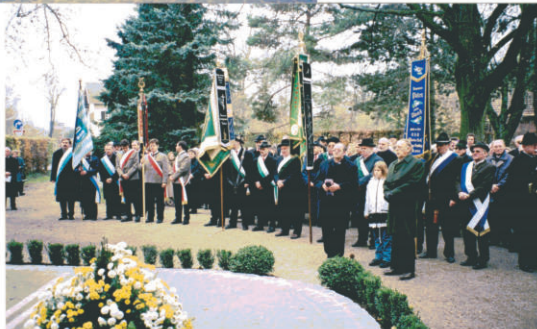
Volkstrauertag - Einweihung 1999