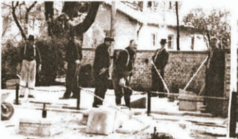
Neuer Boden in den 60er Jahren