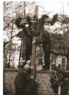
Volkstrauertag 2001 das neue Kreuz wurde aufgestellt